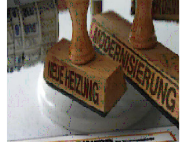
Energieausweise für Wohn- und Nichtwohngebäude