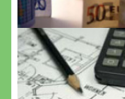
Anträge für Staatliche Fördermittel